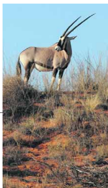
Gemsbok in Kgalagadi Transfrontier Park.