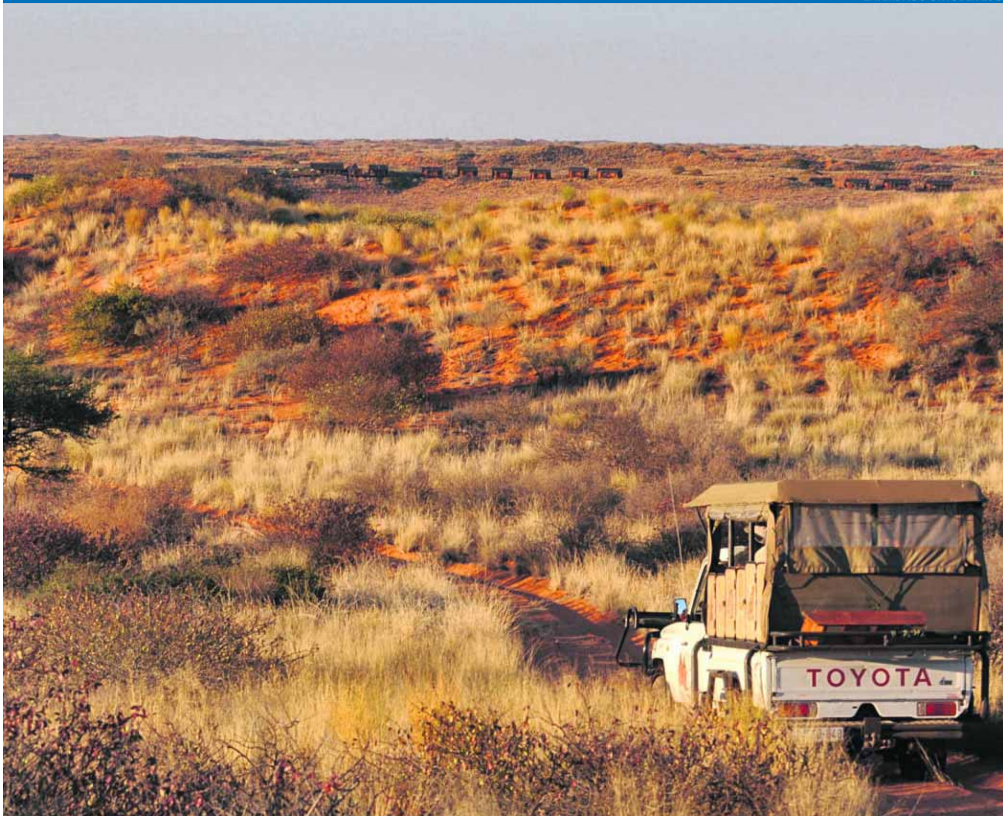
Op safari in Kgalagadi Transfrontier Park.