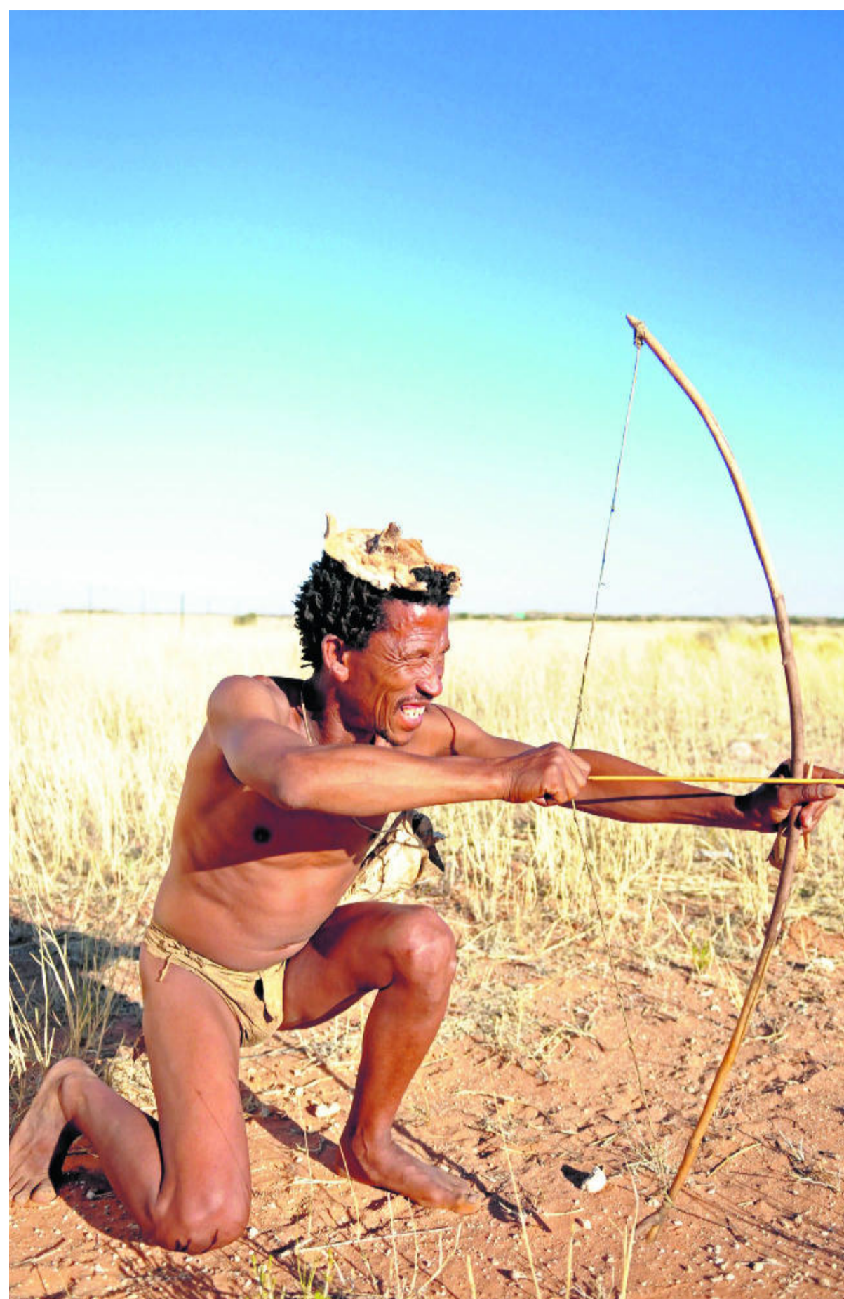
Het traditioneel bekende beeld van de Bosjesman.