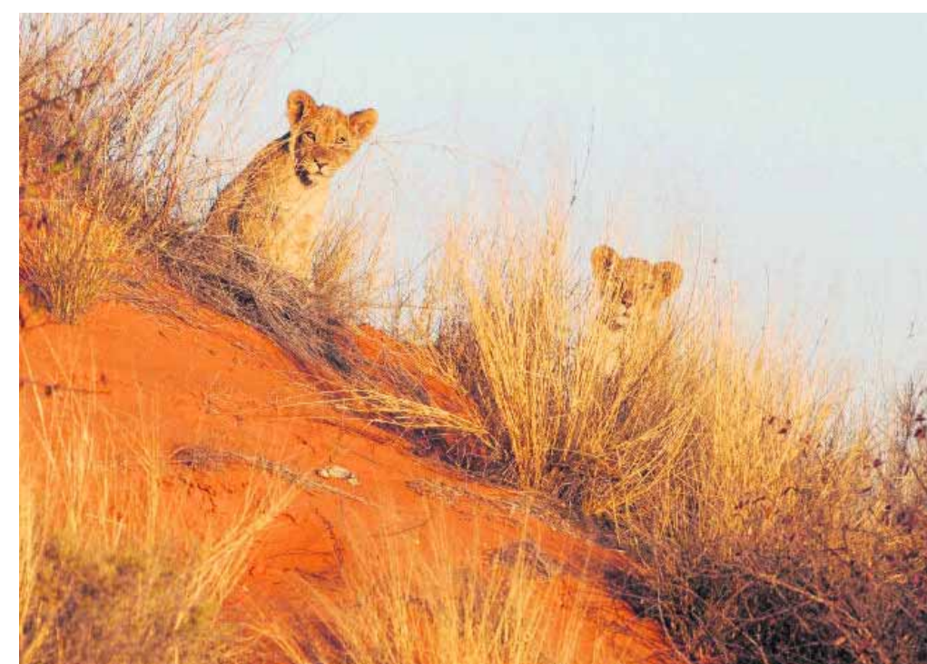
Er leven ongeveer 450 leeuwen in het Zuid-Afrikaanse deel van het natuurpark.