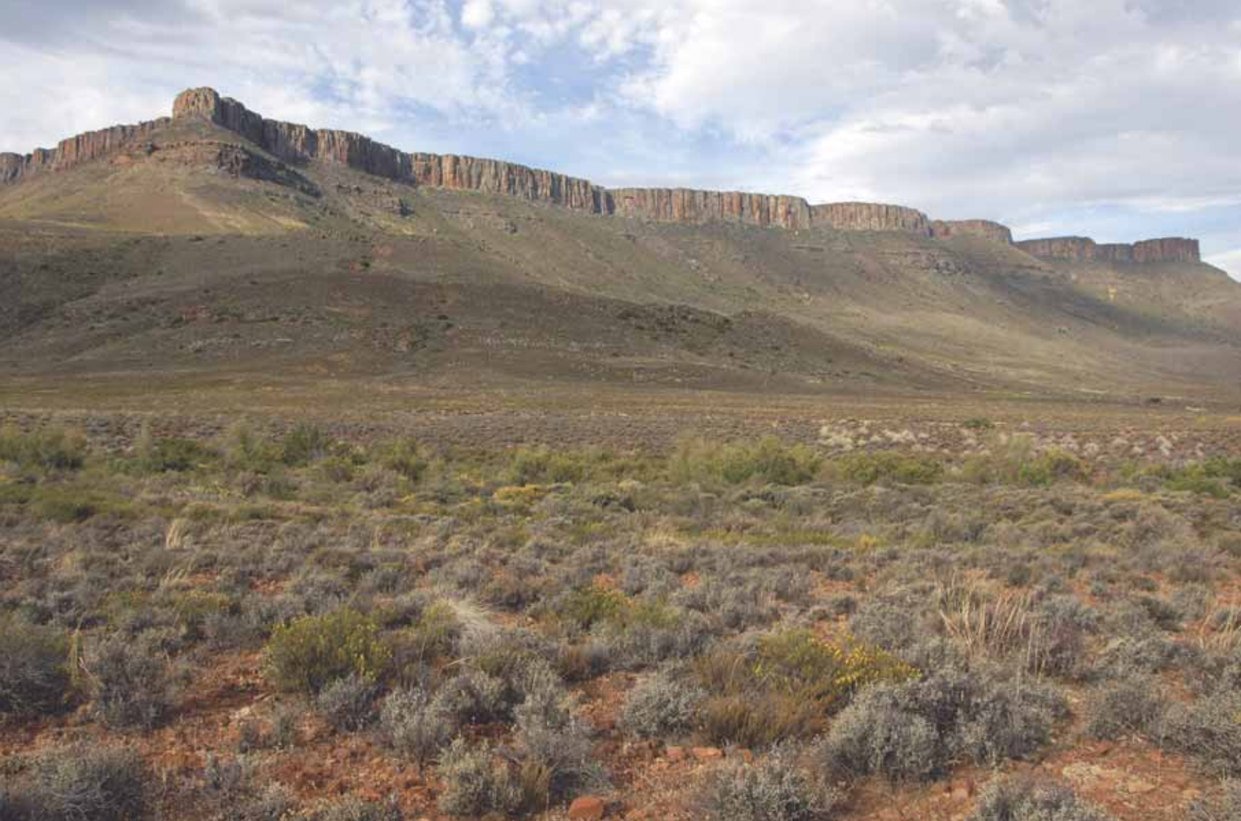
Boven De fraaie Hatam Range nabij Calvinia Onder links Bij eb kun je naar de vuurtoren van Corbière Point lopen Onder links De overdonderende Augrabies Falls Onder rechts Fraaie rotspartijen in Augrabies Falls National Park