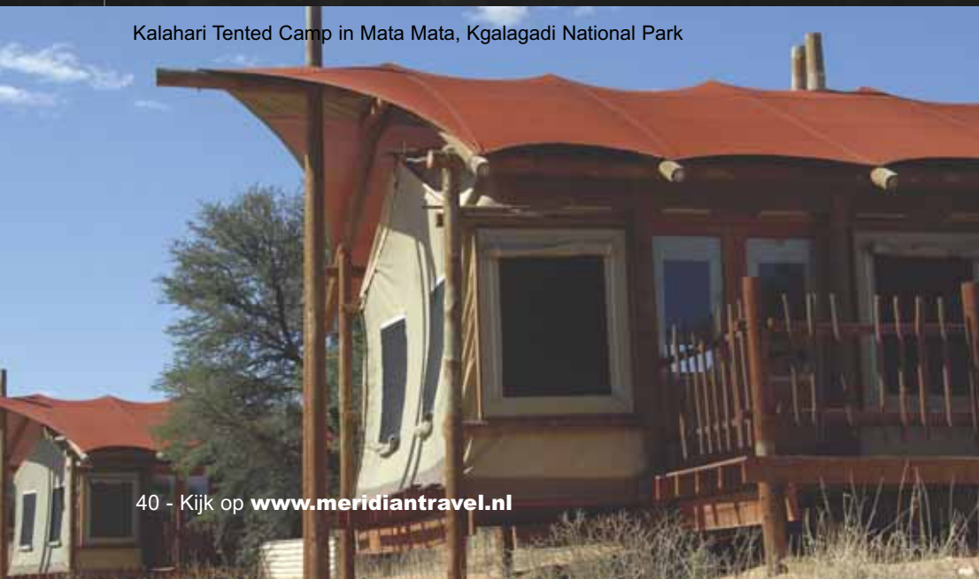
Kalahari Tented Camp in Mata Mata, Kgalagadi National Park

In de Noordkaap zijn de overnachtingsmogelijkheden niet talrijk. Daarom is het te overwegen om vooraf je accommodaties vast te leggen. Als je een fly-drive boekt is dat al voor je geregeld. Meridian Travel! overnachtte bij Die Hatam Huis, Calvinia; Augrabies Falls National Park; Twee Rivieren Camp en Kalahari Tented Camp, Kgalagadi Transfrontier National Park; !Xaus Lodge, Kgalagadi Transfrontier National Park (als je boekt bij QAS holidays voor de periode van oktober 2010 tot 1 april 2011 krijg je dertig procent korting bij de !Xaus Lodge; zie www.qasholidays.nl ); Uitspan Guest Farm, nabij Upington; en De Herberg Lodge, De Aar.